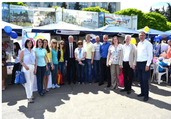
Reprezentanții AȘM la zilele Europei în Moldova

La 10 mai 2015, a avut loc celebrarea Zilei Europei la Chișinău, unde Academia de Științe a Moldovei, Centrul de Proiecte Internaționale și Rețeaua Punctelor Naționale de Contact, care au promovat activ Programul Orizont 2020 prin materiale informative despre apelurile de finanțare deschise, istorii de succes de participare la Programele-cadru ale UE. În același timp, vizitatorii au fost invitați să participe la "Science Slam Moldova", care se va desfășura la 28 mai 2015 și "Noaptea cercetătorilor" la 25 septembrie 2015, evenimente care vor avea loc la Chișinău. Această activitate a fost continuată la 16 mai 2015 în cadrul Orășelului European organizat la Soroca însoțită de deschiderea oficială a Cetății Soroca, restaurate cu sprijinul fondurilor europene în cadrul proiectului "Jewellerias medievale: Hotin, Soroca, Suceava, Mejekss".